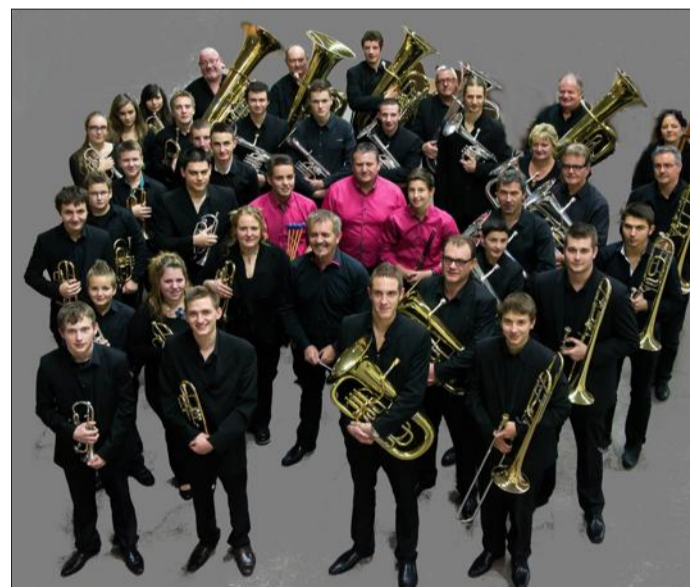
J.N. Les musiciens de la Batterie-fanfare de Riespach.

Y ALLER Dimanche 28 juin, à 16 h, à la salle de musique, rue de Galfin-gue, à Hochstatt. Entrée libre, plateau.